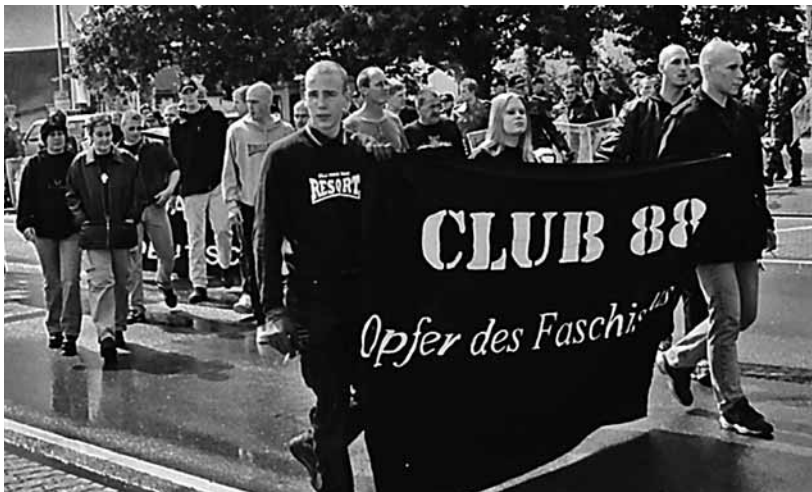
Faschisten vom Club 88 demonstrieren in Kaltenkirchen, 11.8.2001

2. Vielerorts werden menschenverachtende Positionen und Taten aus Angst und Unwillen geduldet. Oft werden sie auch als Taten von Einzelnen oder Verwirrten verharmlost. Es hat System, dass Straftaten zu Lasten von Menschen mit dunkler Hautfarbe nur bei erdrückender Beweislast als "politisch motiviert" eingestuft werden.