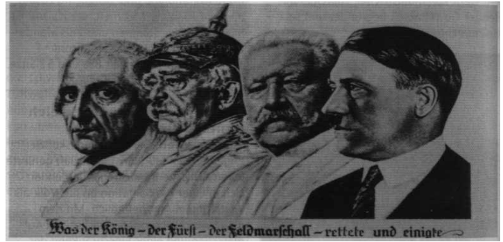
Faschistische Heldenverehrung: König Friedrich II, Kanzler Bismarck, Feldmarschall Hindenburg und Reichskanzler Hitler, Kollage 1933