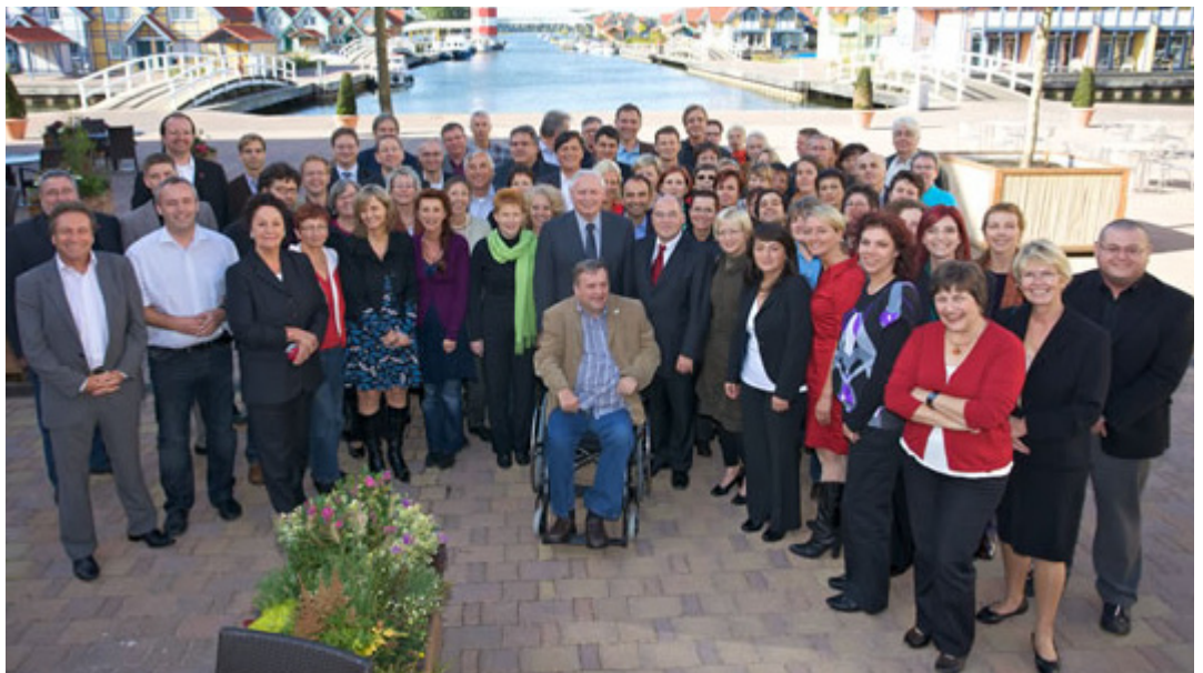
Die neue Fraktion DIE LINKE im Bundestag

Zum 1.1.2010 geplant ist ein Sofortprogramm für Familien mit der Anhebung des Kinderfreibetrages auf 7008 Euro und der Anhebung des Kindergeldes um je 20 Euro. Die Anhebung des Kinderfreibetra-